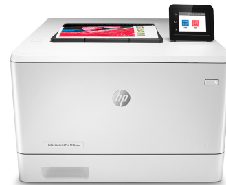
Impresora HP LaserJet Pro a color M454dw

Impresora con seguridad dinámica habilitada. Para ser exclusivamente utilizada con cartuchos que utilicen un chip original de HP. Es posible que no funcionen los cartuchos que no utilicen un chip de HP, y que los que funcionan hoy no funcionen en el futuro. Obtenga más información en: http://www.hp.com/go/learnaboutsupplies