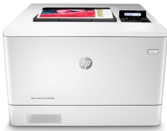
Impresora HP LaserJet Pro a color M454dn

El éxito profesional es sinónimo de una forma de trabajo más inteligente. La impresora HP Color LaserJet Pro M454 se ha diseñado para que puedas centrarte más en el crecimiento de tu empresa y situarte un paso por delante de la competencia.